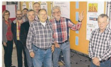
Vertreter der Verwaltung, der Workshops und der Gemeinden stellten die Ergebnisse der Senioren-Umfragen der Öffentlichkeit vor. WITTMACK

Mit dem Konzept soll das dafür notwendige Geld beim Bundesfamilien-Ministerium eingeworben werden. Im Frühjahr 2015 entscheidet die „große Politik“ dann, ob sich die Krempermarsch über den erhofften finanziellen Zuschuss freuen darf. Weil man mit den Vorarbeiten bereits jetzt gut im Zeitplan liege, könnte die Umsetzung dann auch zeitnah erfolgen, versicherte Schramm. aw